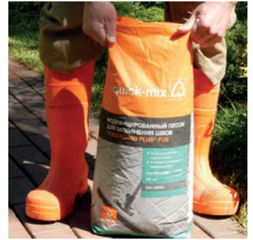
Проростання бур'янів через модифікований пісок FUS